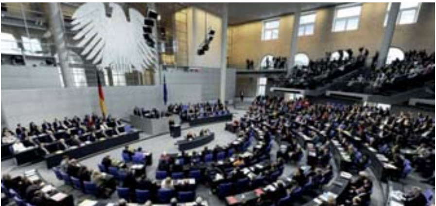
Im Plenarsaal des deutschen Bundestages, Berlin

Das Entwicklungsministerium beteiligt sich an internationalen Verhandlungen und entsendet Mitarbeiter in internationale Organisationen wie auch in Partnerländer. In Deutschland unterstützt das BMZ das entwicklungspolitische Engagement von Bürgerinnen und Bürgern, Nichtregierungsorganisationen, Kirchen, Stiftungen und Wirtschaftsunternehmen. Hierbei unterliegt die Arbeit des Entwicklungsministeriums der parlamentarischen Kontrolle des Deutschen Bundestages. Fachlich zuständig ist der Ausschuss für wirtschaftliche Zusammenarbeit und Entwicklung im Bundestag (AwZ).