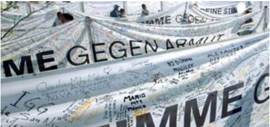
Aktion „Deine Stimme gegen Armut“ vor dem Reichstagsgebäude in Berlin

Das BMZ unterstützt die entwicklungspolitische Arbeit der NRO finanziell, sofern ihre Arbeit den Grundsätzen der deutschen Entwicklungspolitik entspricht. Inhaltlich nimmt der Staat keinen Einfluss auf sie. NRO können durch ihre Unabhängigkeit auch in Ländern und Regionen tätig werden, in denen der staatlichen Entwicklungszusammenarbeit die Hände gebunden sind.