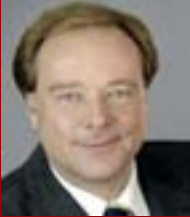
Bundesminister Dirk Niebel

„Entwicklungszusammenarbeit will Menschen die Freiheit geben, ohne materielle Not selbstbestimmt und eigenverantwortlich ihr Leben zu gestalten und ihren Kindern eine gute Zukunft zu ermöglichen.