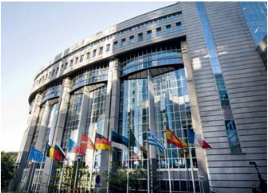
Europäisches Parlament, Brüssel

Bei der Entwicklungszusammenarbeit teilt sich die EU die Zuständigkeit mit ihren Mitgliedstaaten, deren Politiken sie ergänzt.