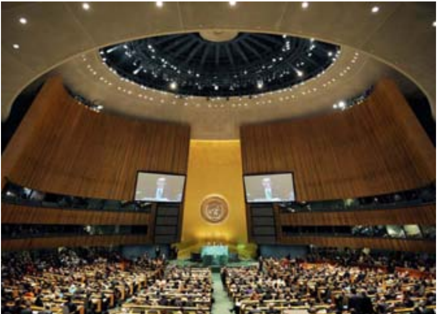
Plenarsaal der Vereinten Nationen, New York

Die internationalen Organisationen und die Europäische Union (EU) finanzieren sich durch ihre Mitgliedsländer. Durch seine Mitgliedschaft bestimmt das Bundesministerium für wirtschaftliche Zusammenarbeit und Entwicklung (BMZ) unter anderem die Politik der Vereinten Nationen, der Weltbankgruppe, des Internationalen Währungsfonds (IWF) und der regionalen Entwicklungsbanken. Ein Schwerpunkt der Arbeit des BMZ ist es, die Effektivität und Effizienz der Arbeit internationaler Organisationen zu verbessern.