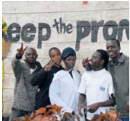
Gesundheitsvorsorge für Kleinkinder und Aidsaufklärung für Jugendliche, Kenia