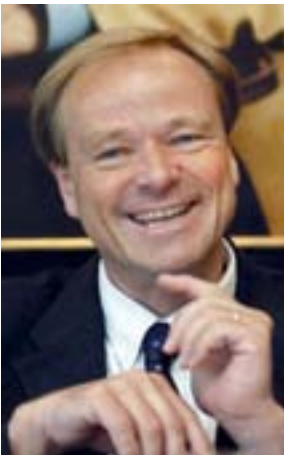
Dirk Niebel Bundesminister