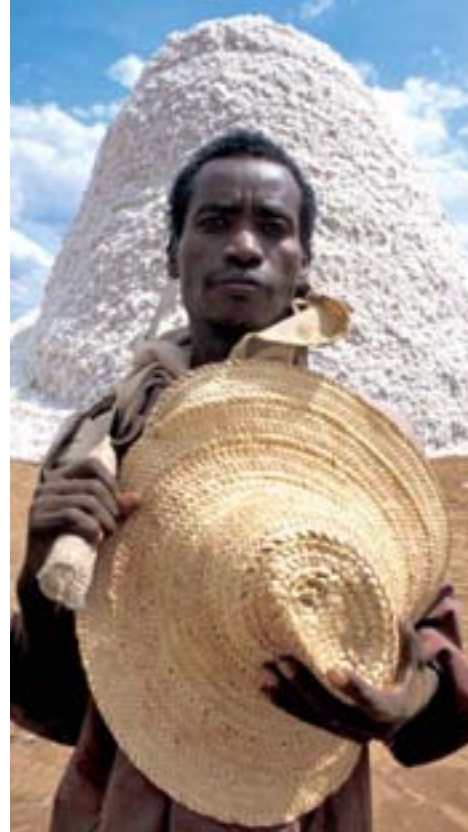
Baumwollpflücker in Äthiopien

Wir reisen in ferne Länder und informieren uns über Internetseiten aus aller Welt. Wo möglich tragen wir gerade Kleidung, die in Asien genäht wurde, die Baumwolle dafür aber ist in Afrika gewachsen. Deutsche Autos und deutsche Waschmaschinen werden in die ganze Welt verkauft. Das ist Globalisierung. Sie macht das Leben angenehmer. Sie birgt Chancen, aber auch Risiken. Klimawandel und Umweltprobleme machen nicht an nationalen Grenzen halt. Wirtschaftskrisen in anderen Ländern schaden auch uns in Deutschland. Die Globalisierung lässt uns alle enger zusammenrücken. Das heißt, dass wir Lösungen für globale Probleme nur gemeinsam mit anderen Ländern finden können. Der Großteil der Menschheit lebt in Entwicklungsländern. Es ist ein Gebot der Menschlichkeit, es ist aber auch in unserem ureigensten Interesse, auch allen Menschen in anderen Ländern zu helfen, ihr Leben in Freiheit, Sicherheit und Wohlstand zu leben.