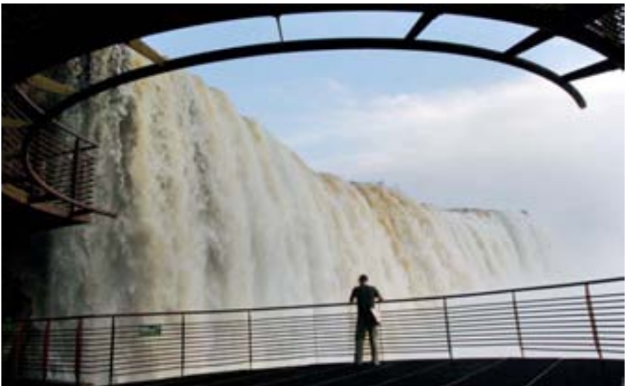
Wasser ist Energieerzeuger, Brasilien

Nicht zuletzt sichert Entwicklungspolitik weltweit Frieden und Stabilität. Entwicklungspolitik ist somit beides: werte- und interessengeleitet.