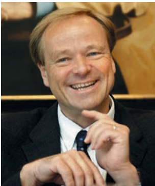
Dirk Niebel, MdB Bundesminister für wirtschaftliche Zusammenarbeit und Entwicklung

Mehr Wirksamkeit Mehr Sichtbarkeit Mehr Engagement Mehr Wirtschaft Mehr Bildung Mehr Demokratie