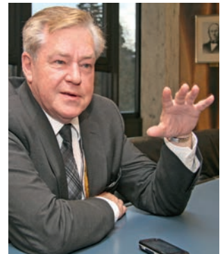
Hans-Jürgen Beerfeltz Der Staatssekretär des Bundesministeriums für wirtschaftliche Zusammenarbeit und Entwicklung